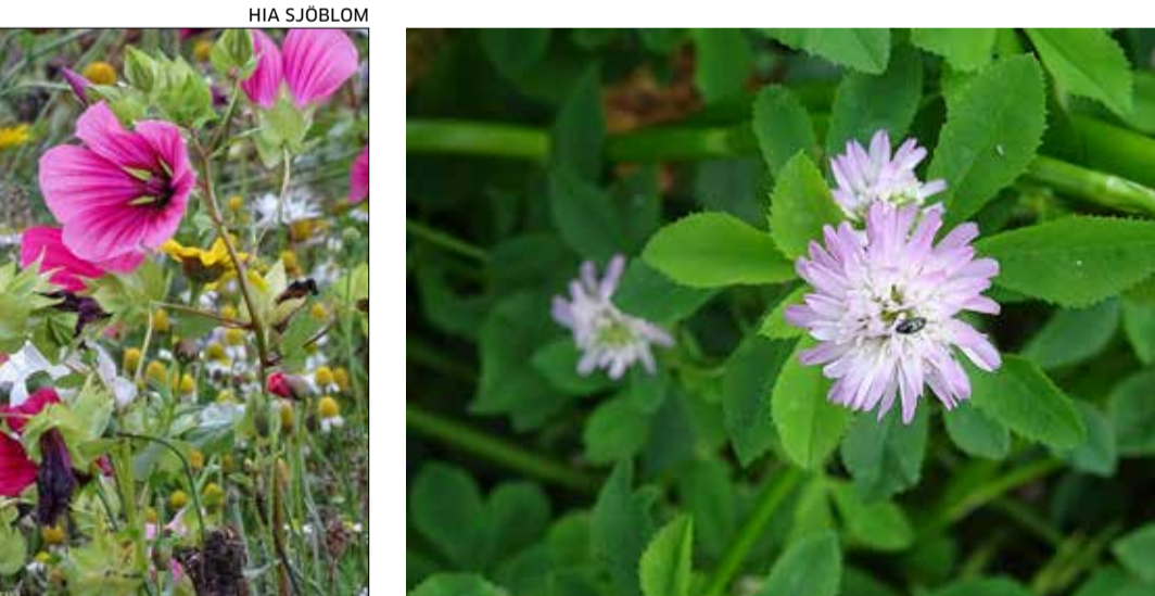
Yksivuotinen persianapila tuo väriä ja monimuotoisuutta riistapelloon.