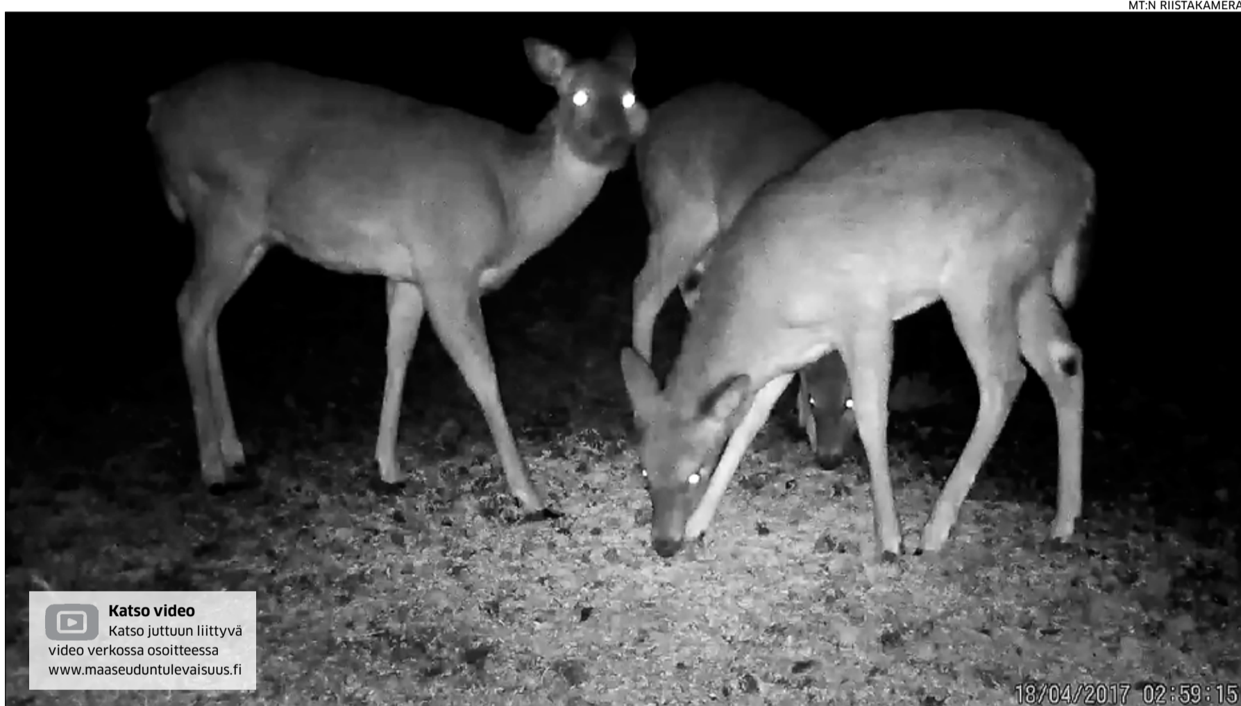
MT:n riistakamera on pellolla, johon on kylvetty riistasiemenseosta. Se sisältää muun muassa naurista, rehukaalia, sinimallasta ja sokerijuurikasta. Ruokintapaikka on varsinkin peurojen suosiossa.