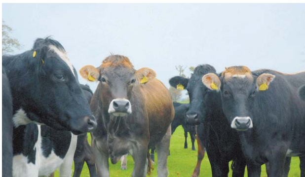
Lancasterissa talkoilla ja yhdistysvoimin perustetulla ja ylläpidetyllä Fairfieldin suojelualueella pääsee kurkistamaan esimerkiksi hyönteishotelliin, jonka asukkaat ovat tärkeitä laitumien ja peltojen monimuotoisuudelle.

teuttajatasolla. Mistä viljelijä Walesissa tai Suomessa tietää, mihin pitäisi panostaa, ennen kuin tukipäätökset ovat täsmälliset?